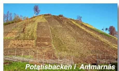
Potatisbacken i Ammarnäs