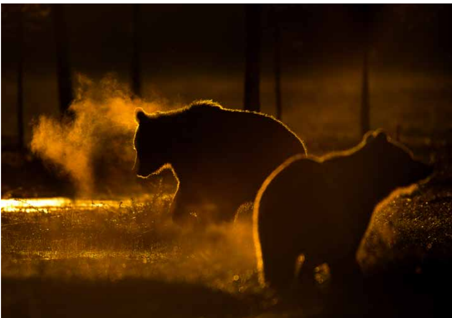
Efter en mycket kall natt kom dessa två björnar in på arenan just som solen gick upp klockan 03.10 i Finland.